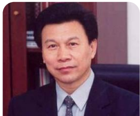
杨步亭 原中影集团董事长

杨步亭： 历任中国电影科研所所长，国家广电总局电影事业局副局长，中影集团董事长，中国电影发行放映协会会长，中国电影海外推广有限责任公司董事长。