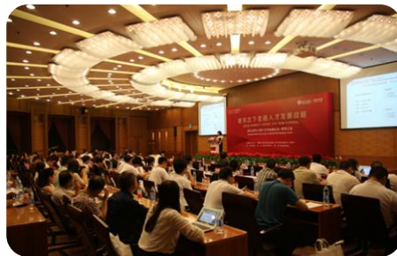
紫荆之夜金融论坛