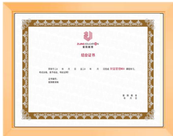
紫荆教育结业证书