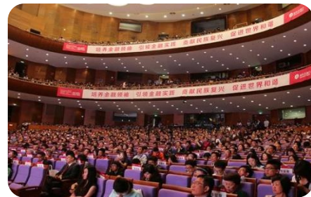
紫荆全球经济论坛