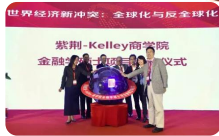
Kelley商学院金融学硕士